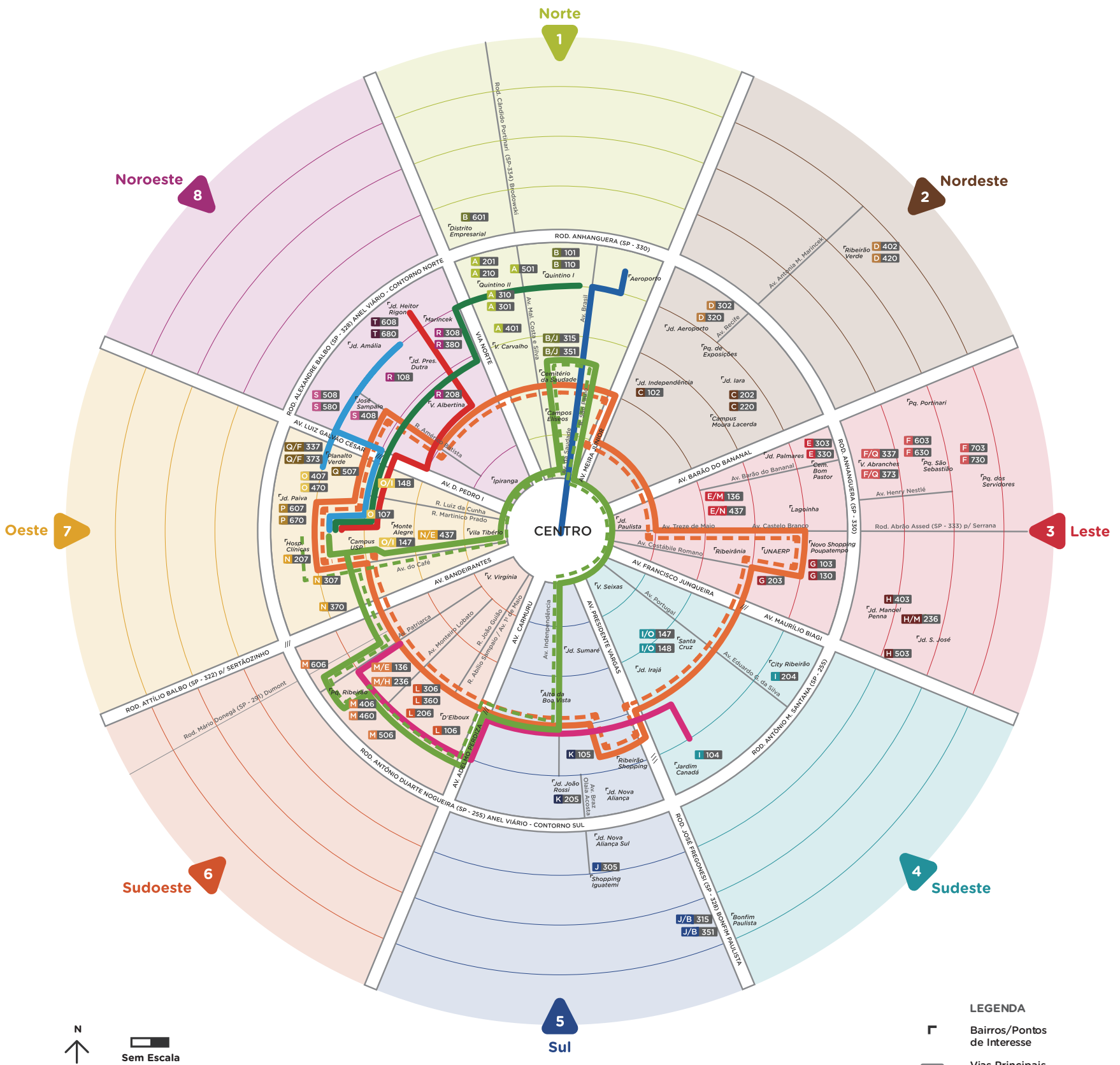
DIAGRAMA DA REDE 3ª Edição - Dezembro/2016